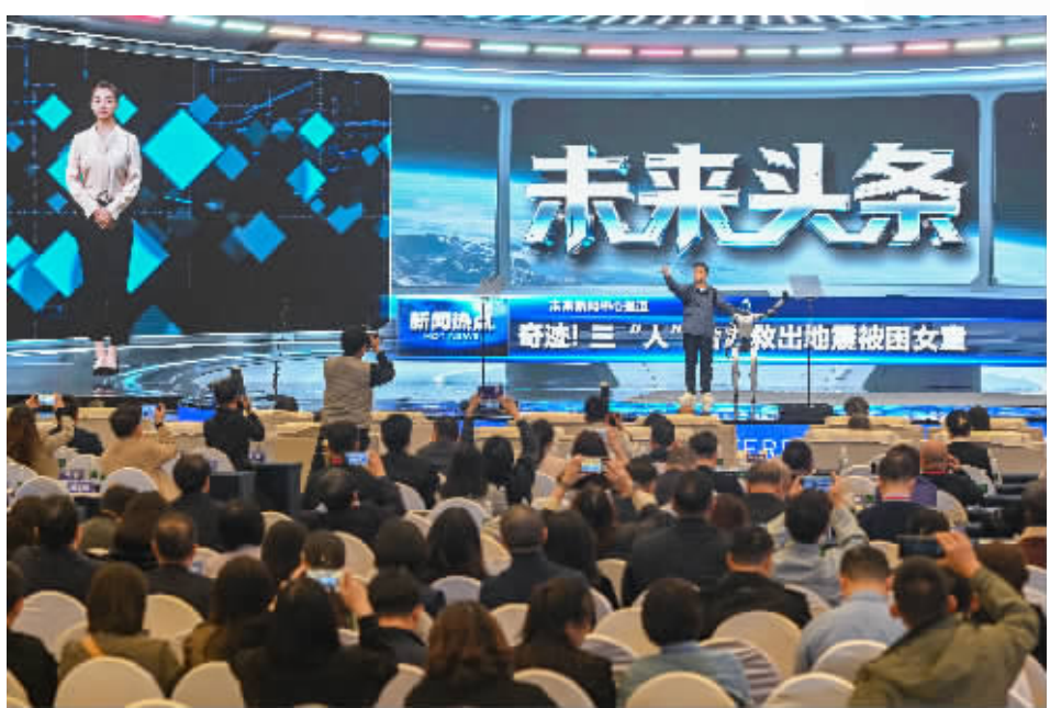
11月12日，现场进行《未来头条》情景展示。当天，2025中国新媒体大会在长沙开幕。