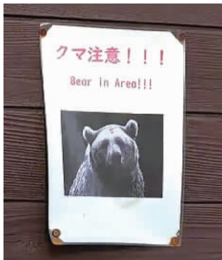
这是近日在日本秋田县的日本自卫队设置的用于捕熊的陷阱和当地政府发布的安全警示。

今年日本熊袭击人事件频发，仅11月9日上午就有生活在3个县的共5人遭熊袭击。受“熊害”影响，本应是旅游旺季的红叶观赏季不少商家经营惨淡。