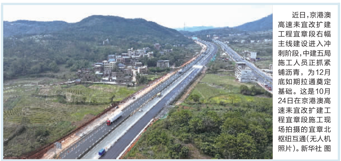
近日，京港澳高速耒宜改扩建工程宜章段右幅主线建设进入冲刺阶段，中建五局施工人员正抓紧铺沥青，为12月底如期拉通奠定基础。这是10月24日在京港澳高速耒宜改扩建工程宜章段施工现场拍摄的宜章北枢纽互通(无人机照片)。

针对特殊学生群体，《措施》体现精准关怀，要求对留守儿童、流动儿童、孤儿等群体建档立卡，“一生一策”加强心理健康指导，每学期至少开展1次家访。 此外，《措施》致力于构建家校社协同的“护心”网络。家庭层面，学校每学期至少组织2次家庭教育指导活动，将心理健康作为必讲内容，引导家长营造和谐和睦的家庭环境；学校层面，开展心理健康教育培训，提升教师“育心”意识和能力，实施“护苗行动”，坚决防止学生欺凌，并鼓励利用人工智能技术开发“AI心理助手”“智能减压室”等；社会层面，要求推进建设全国学生心理健康监测预警系统，每年组织开展1次心理健康抽样监测，会同卫生健康、公安、网信等部门建立学生重大心理问题线上线下发现机制，会同民政、共青团和少先队、妇联等建设社区心理服务平台，营造全社会关心学生心理健康的良好氛围。