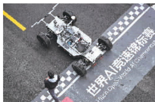
10月17日,海南大学Azure Matrix蔚蓝矩阵战队的参赛选手在赛前调试比赛用车。