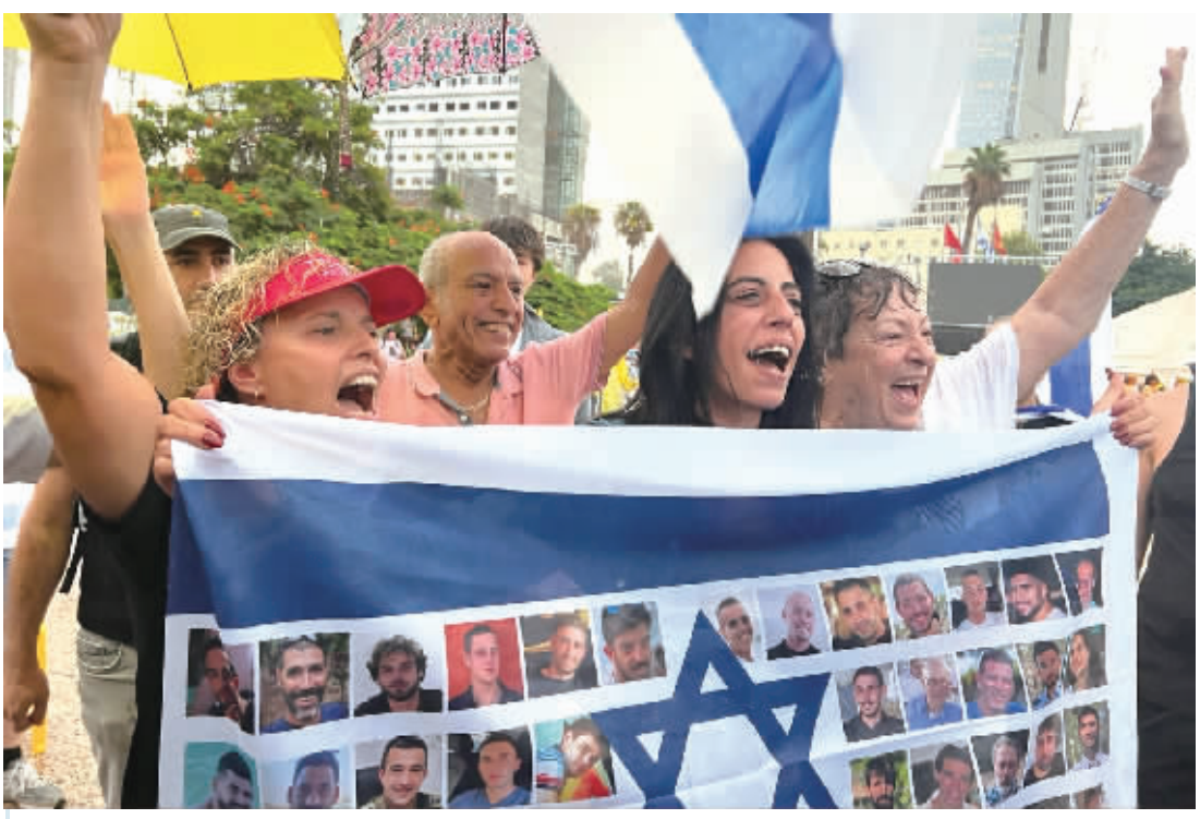
10月9日,以色列被扣押人员亲友在特拉维夫庆祝达成停火协议。

特朗普已表示,他可能于本周末前往中东。欧洲媒体分析,特朗普急于促成以色列和哈马斯达成协议,一大原因在于试图影响诺贝尔和平奖的评选结果。特朗普此前公开宣称,若他未能获得诺贝尔和平奖,这将对美国的“侮辱”。 特朗普8日谈及获得诺贝尔和平奖的可能性时说:“我们解决了七场战争,我们接近解决第八场战争……我认为历史上没有人解决过这么多战争,但也许他们(诺贝尔委员会)会找个理由不把奖(诺贝尔和平奖)颁给我。”