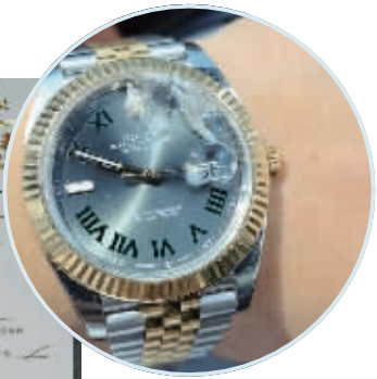
匡先生的手表。