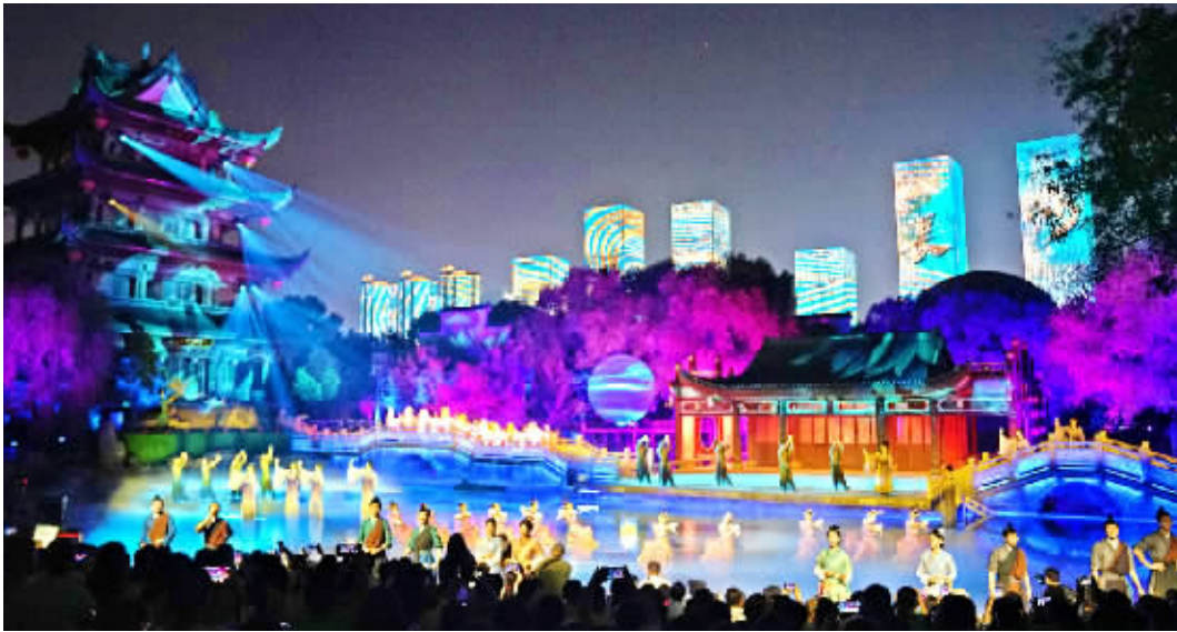
9月28日晚,观众在长沙橘子洲欣赏由华夏芙蓉文旅全新打造的《花开橘洲·江天暮雪》光影诗画秀演出。