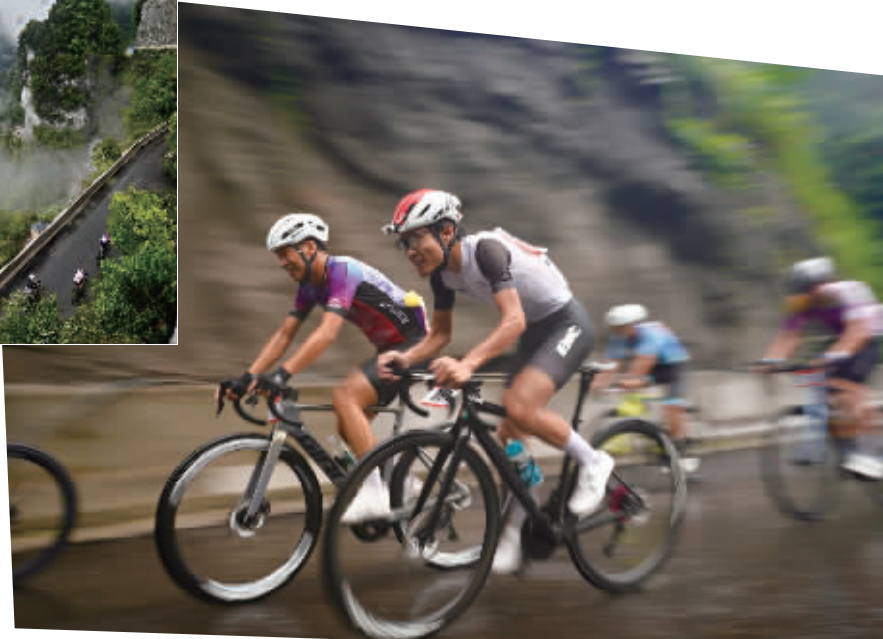
1500名骑手逐鹿张家界天门山“天路”挑战赛。

99道急弯,最大坡度14%,从180米攀升至1100米——这不是科幻大片的赛道,而是真实存在的张家界天门山“天路”。9月14日上午,湖南省第十三届“美利达杯”天门山“天路”自行车挑战赛在这里鸣枪开赛,来自中国、美国、英国、法国等国家和地区的1500名骑手,在这条被誉为“挂壁公路”的赛道上,用双轮演绎了一场速度与意志的极限对决。 开幕式上,张家界市人民政府副市长汪涛宣布比赛正式开始。随着发令枪声响起,1500名骑手宛如离弦之箭般冲出起点,骑行的风声、呐喊声在山谷间回荡,瞬间点燃了赛道两旁观众的激情。 本次大赛共设置男子公路精英组、男子公路大众组、女子公路组、女子山地组、男子山地组五个组别,年龄跨度从18岁至65岁。比赛全程16公里,选手们从180米海拔的山脚起步,沿着天门山盘山公路一路向上,直至1100米的天门