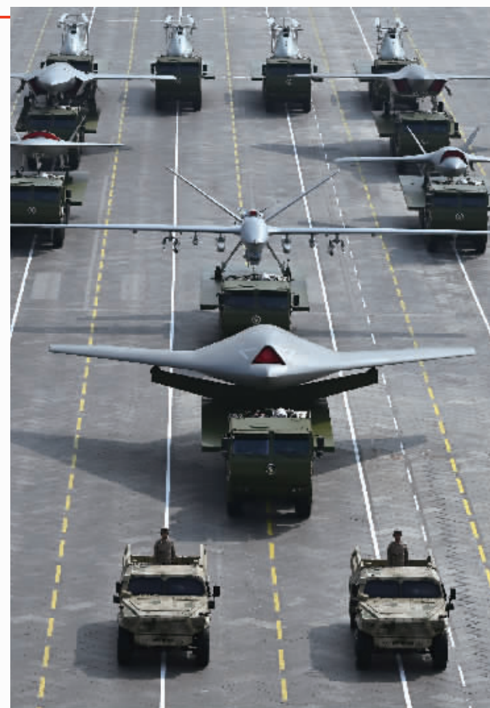
这是空中无人作战方队接受检阅。