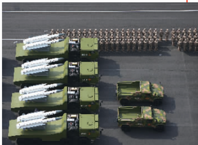
这是反舰导弹方队准备接受检阅。