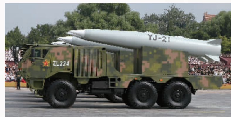
这是高超声速导弹方队接受检阅。