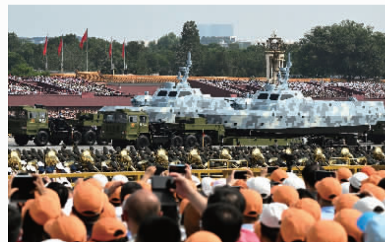
这是海上无人作战方队接受检阅。