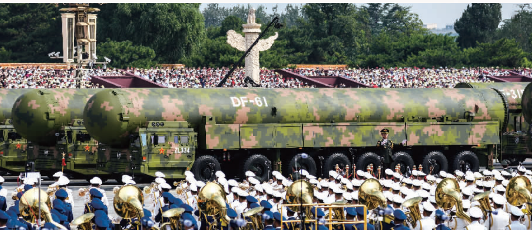
这是核导弹第一方队接受检阅。