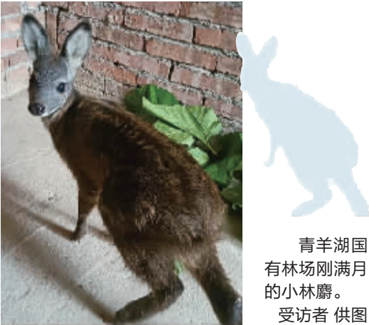
青羊湖国有林场刚满月的小林麝。