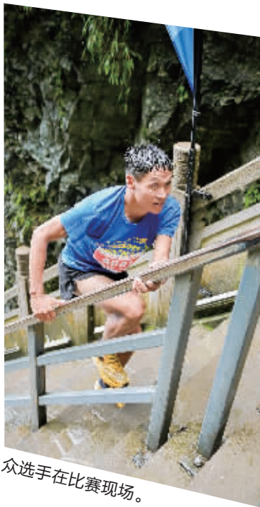
众选手在比赛现场。