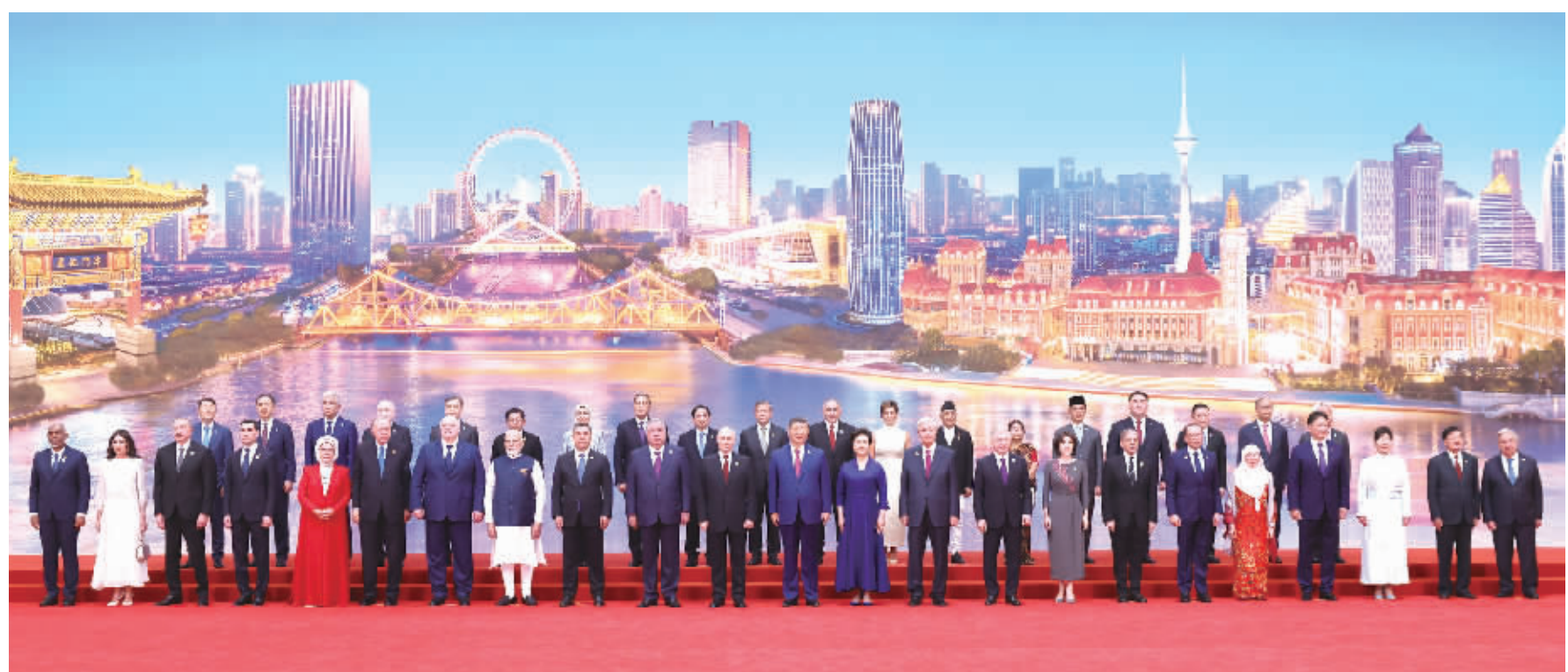
8月31日晚,国家主席习近平和夫人彭丽媛在天津梅江会展中心举行宴会,欢迎来华出席2025年上海合作组织峰会的国际贵宾。这是宴会前,习近平和彭丽媛同贵宾们集体合影留念。