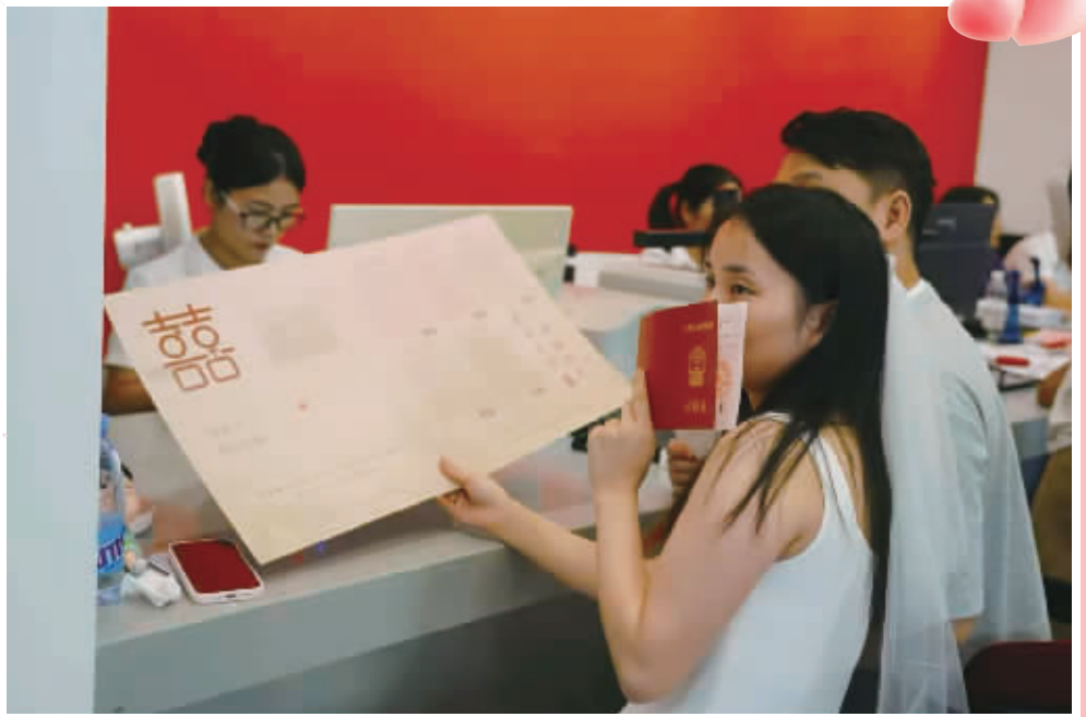
8月29日,七夕佳节,不少新人选择这个甜蜜的日子携手领证。

■文/视频 三湘都市报全媒体记者 杨昱 吴忠强 羊咪米 何佳洁 通讯员 蒋艾林 刘美莹