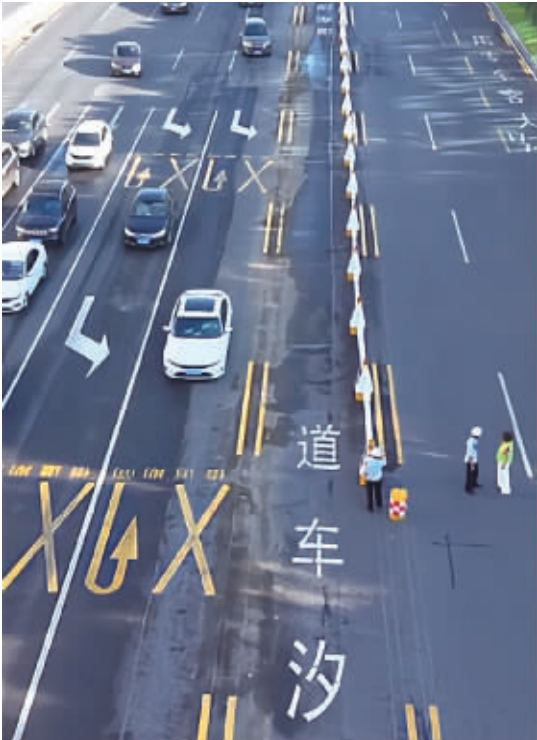
8月26日，长沙首条“机器人式潮汐车道”启用。