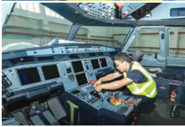
8月22日,南航首次在中部地区启动空客飞机拆解业务。这是中国南航航空的工程师们正在长沙拆解一架具有18年机龄,光荣退役的空客A319飞机。