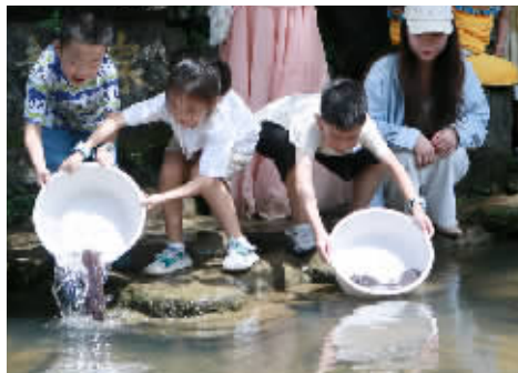
黄龙洞外溪流龙泉放流现场。