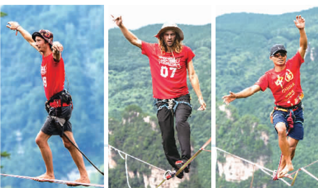
波兰选手雅各布·莫拉夫斯基获得亚军。 卢森堡选手阿奇·威廉姆斯获得冠军。 中国选手何锦毅获得季军。

作为6号线向东延伸的“最后一环”,东延段隧道已实现双线贯通,目前正进行轨道安装,明年将与6号线贯通并与机场T3航站楼同步运营,进一步加密城东交通网络。 6号线东延段工程位于长沙县黄花镇,西起6号线已运营黄花机场T1T2站,东至在建黄花机场T3站,线路长约4.22千米,均为地下线,设站1座。该项目建成后将黄花机场T1T2、T3航站楼直接连入长沙轨道交通线网,开启长沙航空、磁浮、高铁、地铁一体化交通运输新模式。市民可从主城区任意地铁站乘坐地铁直达黄花机场T3航站楼,真正实现“零距离换乘”“无缝化衔接”。