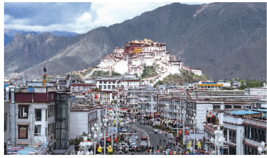
这是8月19日拍摄的拉萨市街景。在庆祝西藏自治区成立60周年之际，拉萨街头张灯结彩，处处洋溢着喜庆氛围。

王沪宁、蔡奇、李干杰、何立峰、张国清、王小洪、洛桑江村、胡春华和张升民，在西藏工作过的老同志，以及中央和国家机关有关部门负责同志，中央代表团全体成员一同观看演出。 ■据新华社