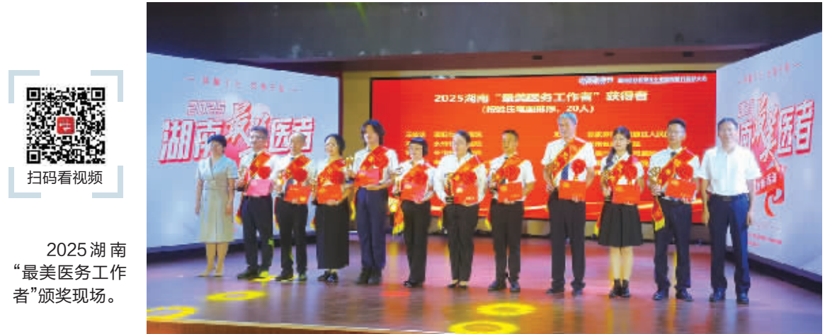
2025 湖南 “最美医务工作者”颁奖现场。

问题,坚决有力纯正政治生态,巩固人民军队纯洁光荣。领导干部要带头真学真懂真信真用,注重运用自身学习成果为官兵搞好宣讲辅导,各级政治工作部门要加强对学习的指导和督促检查,广大理论工作者要加强体系化学理化研究,军队新闻媒体要加大宣传力度、生动反映部队学习贯彻成效,推动理论武装走深走实。要大力弘扬理论联系实际的学风,立牢以实际成效检验学习成果的导向,切实把学习成效转化为奋力攻坚、奋斗强军的生动实践,全面提高履行新时代使命任务能力,以优异成绩迎接建军100周年。 ■据新华社