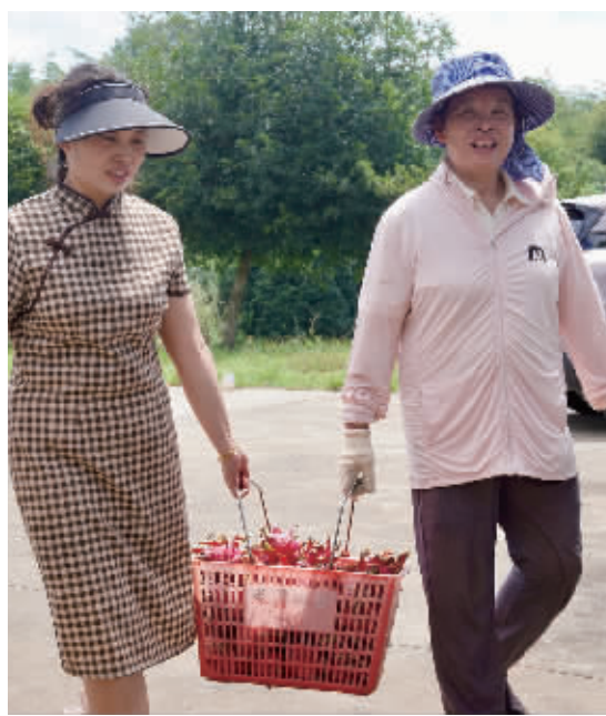
游客在宁乡龙潭山庄四季果园采摘火龙果。

走进望城区乌山街道黄花岭村的葡萄基地,游客们边摘边尝,不时还要带上几箱送给亲朋好友。架上挂着一串串晶莹剔透的阳光玫瑰,在阳光下泛着诱人光泽,清香扑鼻。 “在超市里买葡萄,哪有亲手摘下来的感觉。”游客张女士带着两个孩子第一次进园体验,孩子们在葡萄架间欢快奔跑,兴奋不已。 2019年起,种植户袁奥承包了13亩葡萄园,引入