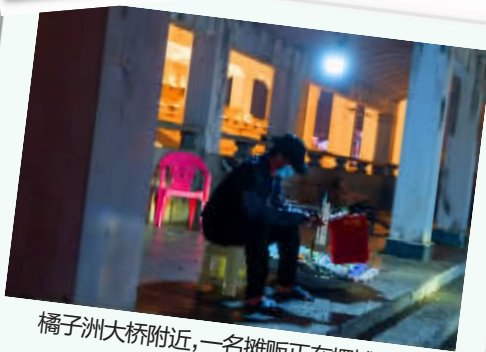
橘子洲大桥附近，一名摊贩正在摆摊。