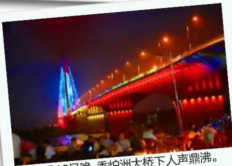
8月13日晚，香炉洲大桥下人声鼎沸。