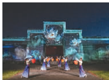
贾谊故居二期策划示意图。