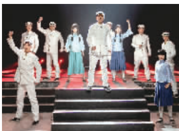
《恰同学少年》青春剧场。