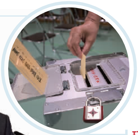
7月20日，选民在日本东京的一处投票站参加投票。