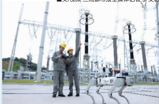
工作人员操控机器狗执行任务。