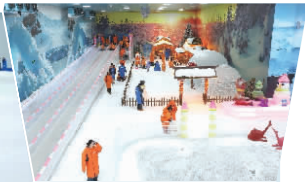
游客在张家界冰雪世界游玩。