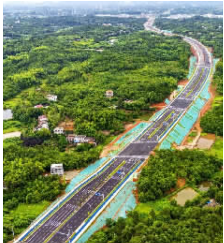
白庭路航拍图。