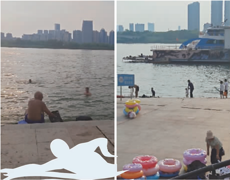
7月8日，记者发现在湘江风帆广场段野泳的人们普遍没有佩戴救生设备。