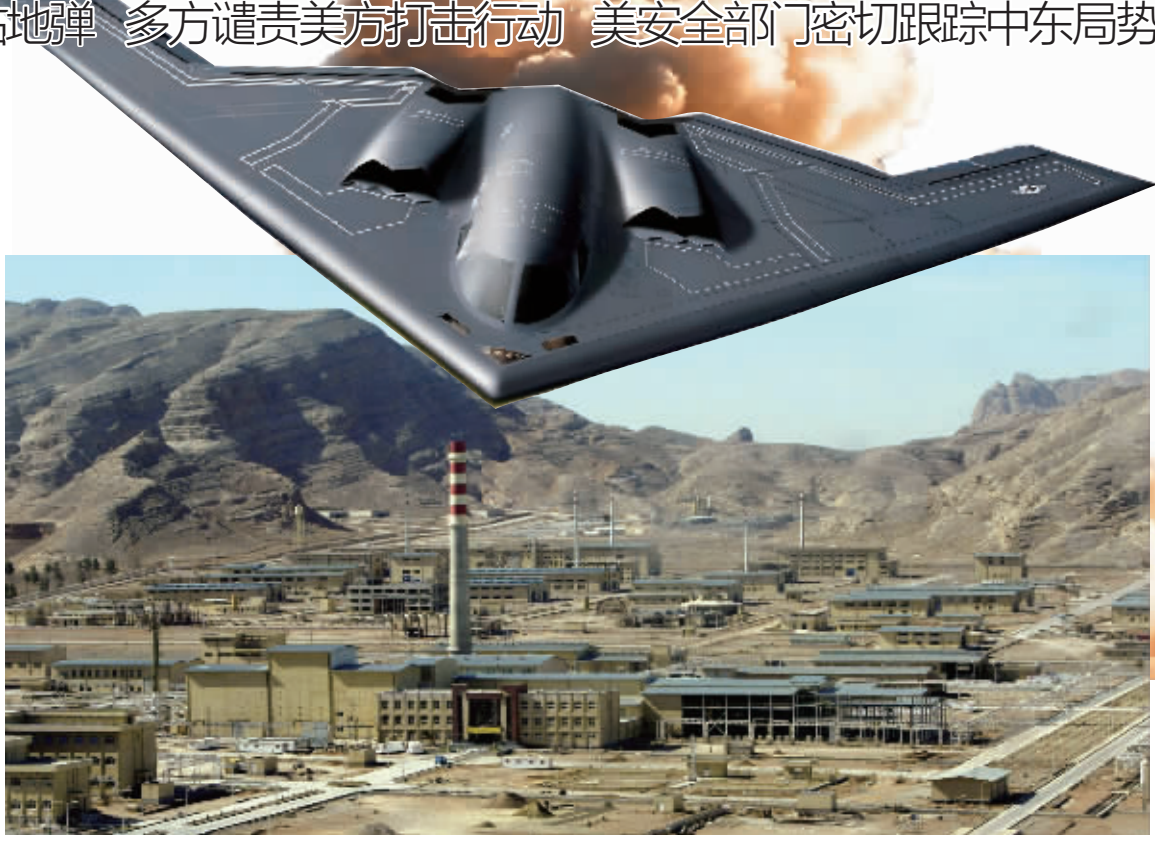
这张2005年3月30日拍摄的资料照片显示的是伊朗伊斯法罕核设施。

据美国有线电视新闻网报道，美国通过秘密渠道告知伊朗，美国的军事行动将“控制在一定限度”，此外美方不准备进一步行动。暂不清楚何为“秘密渠道”。