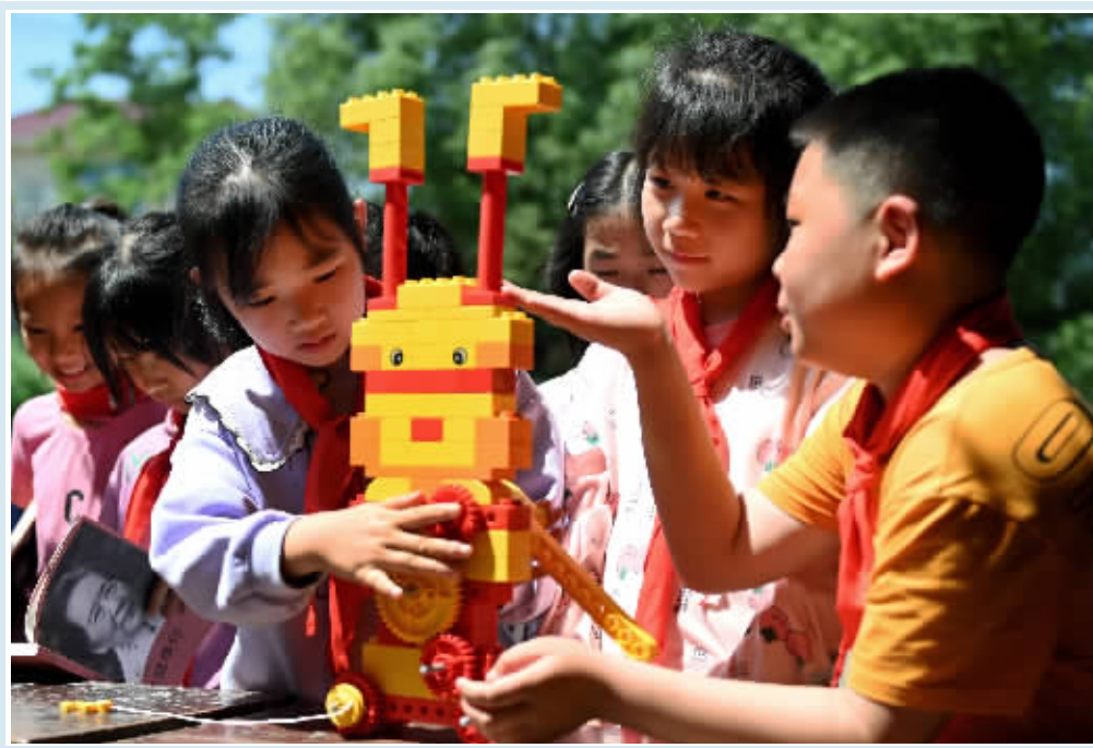
5月26日，学生在体验可动乐高产品。当天，洞口县组织科普志愿者来到高沙镇松华完全小学开展科普进校园活动，学生通过观摩机器人、无人机展示，体验益智类教具等，近距离感受科学魅力。

意见是新时代完善企业制度的纲领性文件，共8个部分、19条具体举措，从坚持和加强党的领导、完善公司治理结构、提升企业科学管理水平、健全企业激励创新制度、建立健全企业社会责任与企业文化体系、优化企业综合监管和服务体系等方面作出全面系统部署，重在以制度创新赋能企业发展，进一步释放微观主体活力，培育更富活力、更具韧性、更有竞争力的现代企业，为以中国式现代化全面推进强国建设、民族复兴伟业提供有力支撑。 意见提出了中国特色现代企业制度的具体内涵，即以坚持和加强党的领导为根本，以产权清晰、权责明确、政企分开、管理科学为基础，以完善公司治理为重点，以改革创新为动力，弘扬企业家精神，适合国情、符合实际、满足发展需要的现代企业制度。 中国特色现代企业制度具备各国现代企业制度的共同特征，更有基于中国市场经济、制度环境以及社会传统文化等国情的“中国特色”，是在现代企业制度一般性理论与实践基础上能够发挥中国特色社会主义制度优势的企业制度。 完善公司治理结构 建立新型经营责任制 意见明确，健全企业产权结构。尊重企业独立法人财产权，形成归属清晰、结构合理、流转顺畅的企业产权制度。 完善国有企业公司治理。加快建立健全权责法定、权责透明、协调运转、有效制衡的公司治理机制，强化章程在公司治理中的基础作用。党委（党组）发挥把方向、管大局、保落实的领导作用。股东会是公司的权力机构，股东按照出资比例和章程行使表决权，不得超出章程规定干涉企业日常经营。董事会发挥定战略、作决策、防风险的作用，推动集团总部授权放权与分批分类落实子企业董事会职权有机衔接，规范落实董事会向经理层授权制度。完善外部董事评价和激励约束机制，落实外部董事知情权、表决权、监督权、建议权。经理层发挥谋经营、抓落实、强管理的作用，全面推进任期制和契约化管理。鼓励国有企业参照经理层成员任期制和契约化管理方式，更大范围、分层分类落实管理人员经营管理责任。 支持民营企业优化法人治理结构。鼓励民营企业根据实际情况采取合伙制、公司制等多种组织形式，完善内部治理规则，制定规范的章程，保持章程与出资协议的一致性，规范控股股东、实际控制人行为。支持引