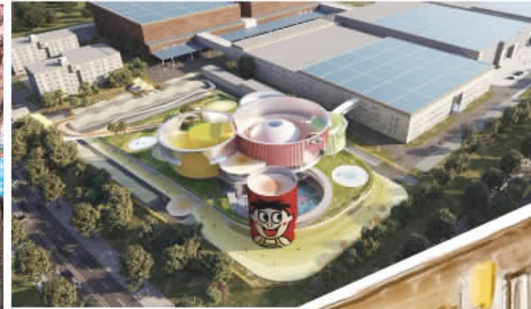
旺旺体验馆。