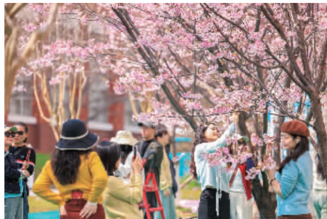
晚安家居文化园。