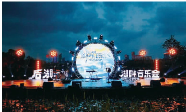
后湖湖畔音乐会。