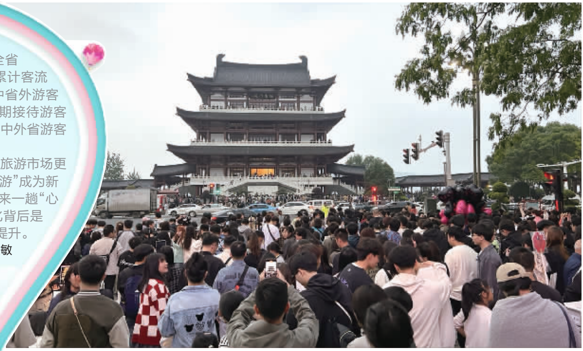
▲“五一”假期，长沙杜甫江阁人气爆棚。王智芳 摄 ◀“五一”假期，株洲方特旅游区双园同欢，日夜嗨玩。丁鹏志 摄