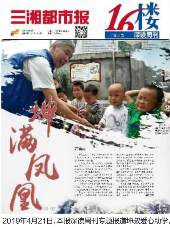
2019年4月21日，本报深读周刊专题报道坤叔爱心助学。