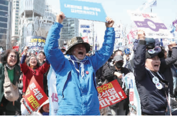
4月4日,民众在韩国首都首尔的韩国宪法法院附近庆祝尹锡悦弹劾案获得通过。

目前,尽管李在明是呼声最高的总统候选人。不过,李在明涉嫌违反《公职选举法》案件三审判决尚未宣判,他的竞选前景仍存在不确定性。前国会议员刘承昀认为,如果国民力量党能够推出清廉且有能力的候选人,依然有可能在选举中对抗李在明。 分析人士认为,尽管尹锡悦弹劾案对国民力量党造成一些负面影响,但为了对抗共同民主党,国民力量党党内凝聚力有所提升。韩国全南大学名誉教授崔泳太认为,当前,国民力量党内部加强团结,或将与共同民主党形成势均力敌的局面。在韩国民意撕裂、两党对立不断加剧的背景下,中间选民和无党派民众或将决定新一届总统选举的结果。 自去年12月以来,街头政治已成为韩国的日常。分析人士指出,韩国朝野“保守”与“进步”两大阵营的对立冲突渗透到社会层面,由此引发的民间极端情绪愈发明显,影响韩国政治与社会稳定。韩国《东亚日报》刊文说,政治阵营对立已成为阻碍韩国社会团结的重要原因。 美国《外交》杂志网站刊文指出,尹锡悦被罢免总统职务难以解决韩国不断加剧的政治极化,韩国政治面临更深层次的结构性问题。美国卡内基国际和平研究院研究员李正民指出,尹锡悦被罢免后,政治报复的恶性循环不会平息,韩国的政治阵营对立将进一步加剧,并在社会层面体现出来。 ■据新华社