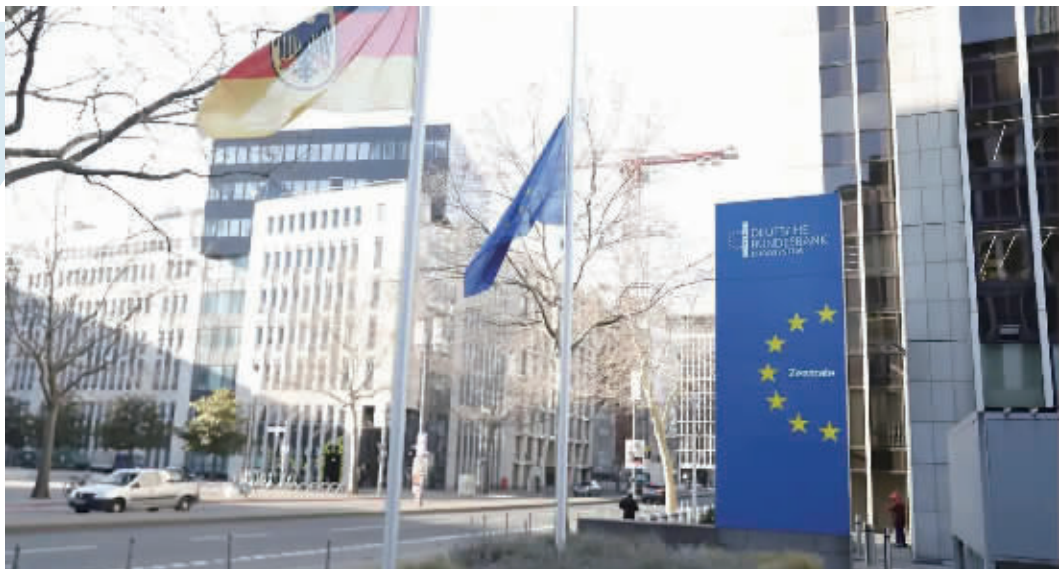
2月18日在德国法兰克福拍摄的德国央行总部。