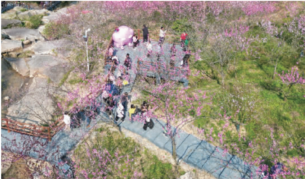
3月22日，宁乡灰汤东鹜山桃花谷内千亩桃林灼灼盛放，游客漫步花海，尽享春日胜景。

清明不仅是踏青时节，更是文化传承的载体。今年湖南多地创新传统文化表达形式，将节俗融入旅游场景。在长沙铜官窑古镇，实景剧本杀《清明上河图》还原宋代市井生活，游客可化身古代商贩，体验蹴鞠、投壶等游戏；岳阳楼景区推出“诗词擂台”，游客身着汉服对诵《离骚》，优胜者获赠非遗竹编工艺品。同程旅行数据显示，此类沉浸式项目预订热度同比上涨近1倍。 清明假期虽短，湖南以高铁为纽带，以“文化游”为核心，吸引全国游客共赴一场“诗与远方”的春日之约。在这个清明，湖南正以湖湘文化书写春日的新篇章。 ■全媒体见习记者 宋科铖 记者 曾冠霖