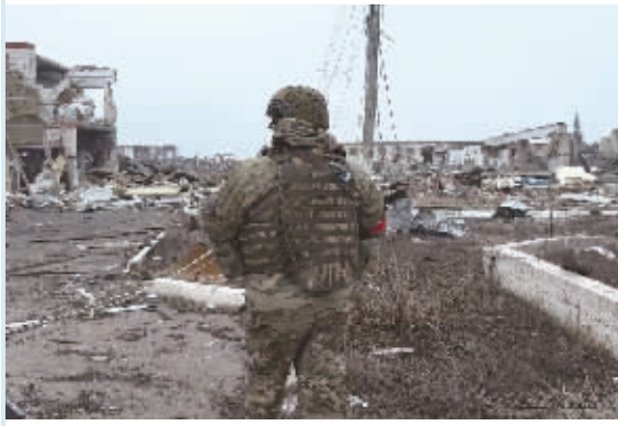
这张俄罗斯国防部3月13日发布的视频截图显示，俄军士兵进入库尔斯克州的一个定居点。

“普京总统和特朗普总统的通话证明了一个众所周知的想法——餐厅里只有俄罗斯和美国。菜单上有：开胃小菜布鲁塞尔芽菜、英式炸鱼薯条和巴黎公鸡。主菜是基辅炸肉排。祝您用餐愉快！” ——围绕俄美总统通话，俄罗斯联邦安全会议副主席梅德韦杰夫在社交媒体平台发文。