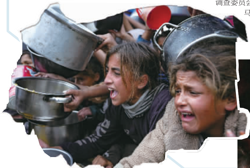
12月20日，人们在加沙地带汗尤尼斯领取食物。