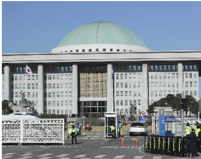
12月4日，警察聚集在韩国首尔的国会议事堂附近。

韩国检察厅紧急戒严特别调查本部11日说，针对参与封锁国会军事行动的陆军特战司令部，检方已展开强制调查，正对其进行扣押搜查。