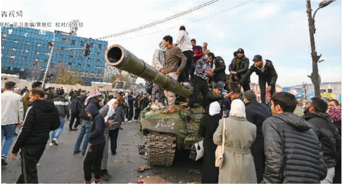
12月8日，人们聚集在叙利亚大马士革的一处广场上。