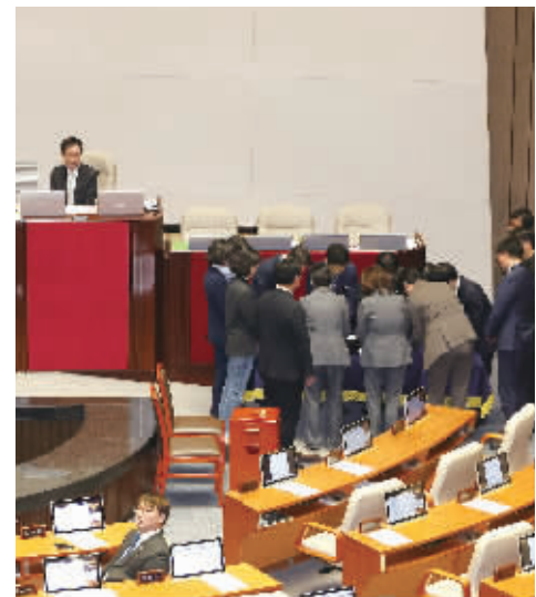
12月7日，在韩国首尔，工作人员就尹锡悦弹劾动议案进行计票。