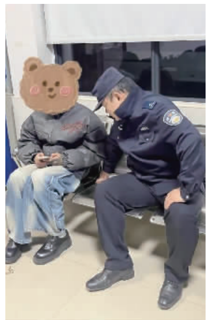
民警在劝导翻护栏男子。