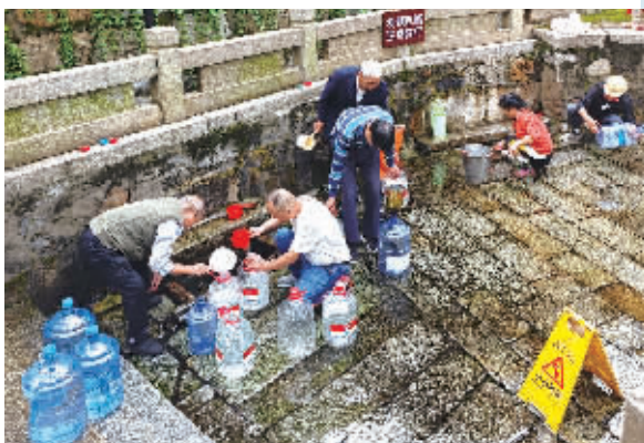
居民在白沙井取水。