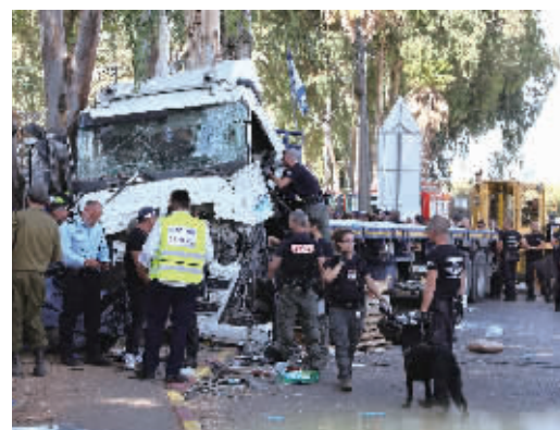
10月27日，在以色列特拉维夫北部，警察和救援人员在事发现场工作。