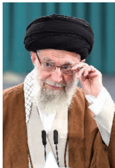
伊朗最高领袖哈梅内伊：不应夸大或淡化袭击。