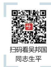
扫码看吴邦国同志生平

中国共产党的优秀党员，久经考验的忠诚的共产主义战士，杰出的无产阶级革命家、政治家，党和国家的卓越领导人，中国共产党第十四届中央政治局委员、中央书记处书记，第十五届中央政治局委员，第十六届、十七届中央政治局常委，国务院原副总理，第十届、十一届全国人民代表大会常务委员长吴邦国同志的遗体，14日在北京八宝山革命公墓火化。吴邦国同志因病于2024年10月8日4时36分在北京逝世，享年84岁。吴邦国同志病重期间和逝世后，习近平、李强、赵乐际、王沪宁、蔡奇、丁薛祥、李希、韩正、胡锦涛等同志，前往医院看望或通过多种形式对