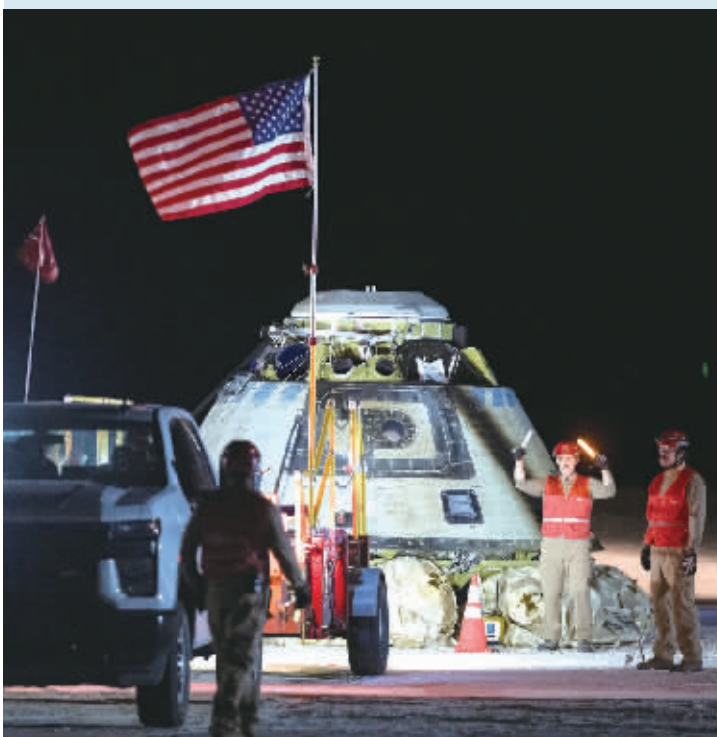
当地时间9月6日，波音公司和美国航天局团队在美国新墨西哥州白沙太空港地区的“星际客机”飞船附近工作。