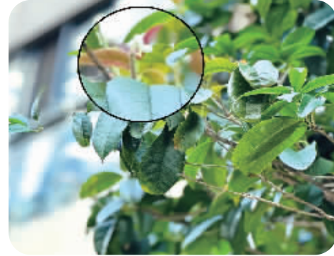
9月3日，长沙市民在湘江中路某小区内拍到的零星桂花。

“现阶段桂花开花仅属于个别现象。”湖南省植物园首席专家吴思政提到，一般来说高温不仅不会提早使桂花开花，相反可能会耽误桂花生长，“虽然桂花属于阳性树种（在较强的光照下才健壮生长的植物），但相对