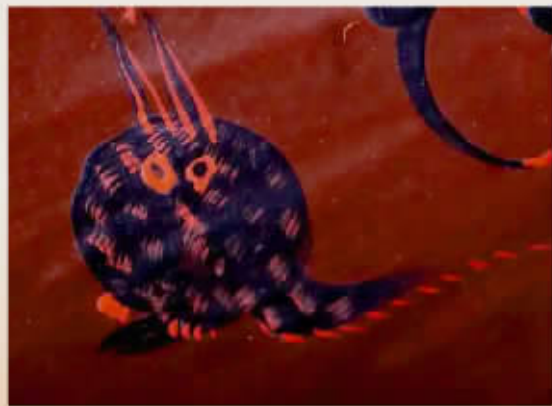
漆食器上的狸猫纹。