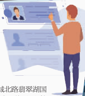
求职者在浏览“人才夜市”数据大屏。

除了微市场，还有24小时不打烊的就业社保智屋。长沙市开福区四方商贸城党群服务中心打造“烟火开福零工家园”，帮助群众实现在家门口就业，辖区还运营24小时开福就业社保智屋。8月7日，记者通过刷身份证进入就业社保智屋内，里面劳动维权、就业信息一目了然，可查社保、搜岗位、学技能和查询相关惠民政策。