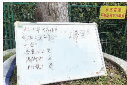
王府花园游泳馆水质自测公示牌。