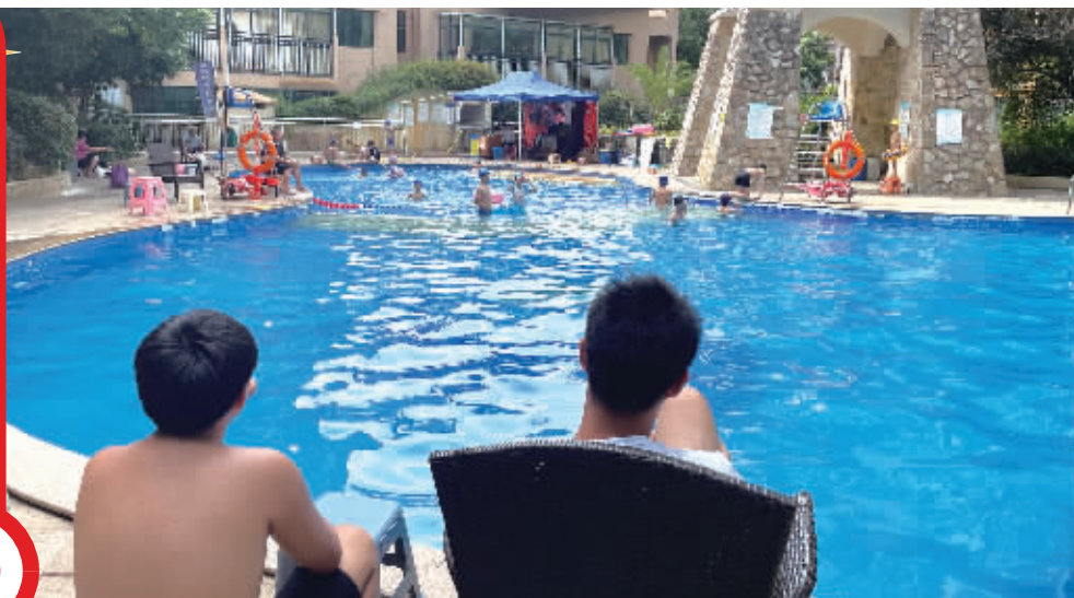
经世·皇城小区游泳池的两名救生员均未取得救生员证。