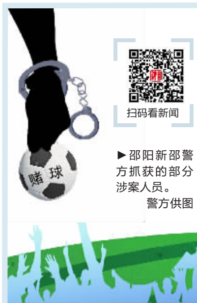
邵阳新邵警方抓获的部分涉案人员。