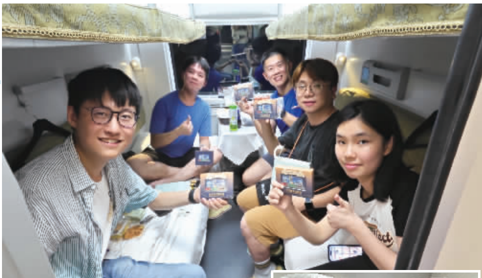
6月15日,乘客在香港西九龙至上海虹桥D908次高铁动卧列车上展示收到的首班车纪念品。当日,京港、沪港间首次开行高铁动卧列车。