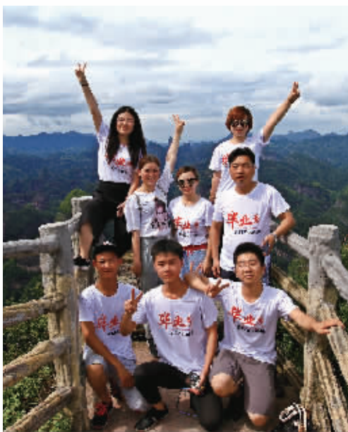
高考后,学生和家在崑山游玩。

想去东南沿海地区,先来看陆上交通。高速公路出行前往杭州、福州的距离都在870公里左右,高速费用在440元附近,如果是一家人前往,还是比较好的出行选择。此外,高铁票也均在450元以内,耗时不长,也是一个比较好的出行选择。